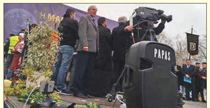
Στα στιγμιότυπα: από αριστερά οι κύριοι Ροζής και Ντούφας κατά την αναχώρηση των λεωφορείων για την Θεσσαλονίκη, ο ΣΤΡΑΤΗΓΟΣ ΚΟΡΚΑΣ στα 98 του συμμετείχε στο συλλαλητήριο για τη ΜΑΚΕΔΟΝΙΑ, όπως και σε όλες τις εκδηλώσεις της ΕΑΑΣ., στο λεωφορείο της Ένωσης στο δρόμο προς Θεσσαλονίκη και ο πρόεδρος της ΕΑΑΣ στο συλλαλητήριο.