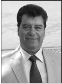
Γράφει ο ΙΩΑΝΝΗΣ ΔΕΒΟΥΡΟΣ Υποστράτηγος (ΕΜ) ε.α. Διευθύνων Σύμβουλος ΕΑΑΣ

Από την στιγμή που οι Σλάβοι απέτυχαν και στις τρεις (3) ένοπλες απόπειρες, να κατακτήσουν την Μακεδονία, ο Τίτο έβαλε σε