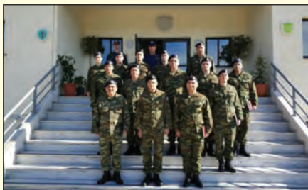
Επίσκεψη στην 871 ΑΒΕΚ