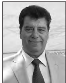
Γράφει ο ΙΩΑΝΝΗΣ ΔΕΒΟΥΡΟΣ Υποστράτηγος (ΕΜ) ε.α. Διευθύνων Σύμβουλος ΕΑΑΣ

1. Για το επόμενο χρονικό διάστημα έχουμε σε εξέλιξη τα παρακάτω θέματα: