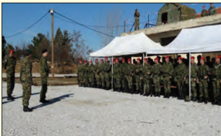
Επίσκεψη στην 71 Α/Μ ΤΑΞ