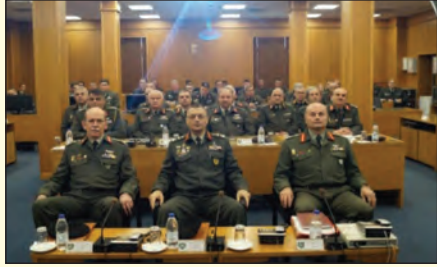
Επίσκεψη στην ΑΣΔΥΣ