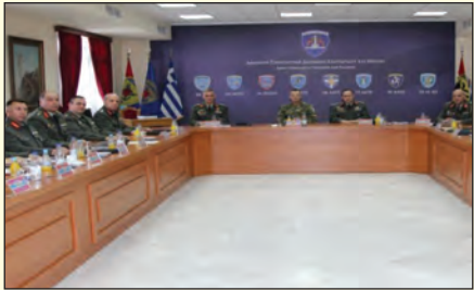
Επίσκεψη στην ΑΣΔΕΝ