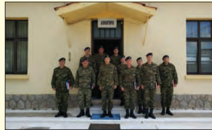
Επίσκεψη στο 3ο ΤΥΛ