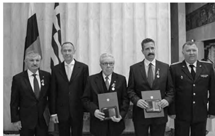
Ρώσων νεκρών υπερασπιστών της Ρωσίας» (κεντρική φωτογραφία άρθρου)

Εκ μέρους του Ρώσου υπουργού άμυνας, Σεργκέι Σοιγκού απονεμήθηκαν μετάλλια τιμής σε τρεις Έλληνες πολίτες στην Ελλάδα «για την διαιώνιση της μνήμης των