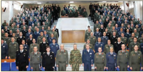
Επίσκεψη στην ΑΔΙΣΠΟ

σε Σχηματισμούς, Σχολές και Υπηρεσίες του Στρατού Ήρρας