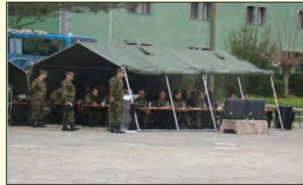
Επίσκεψη στην 180 ΜΚΒ «HAWK»