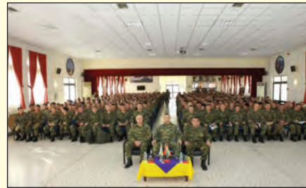
Επίσκεψη στη ΣΜΥ