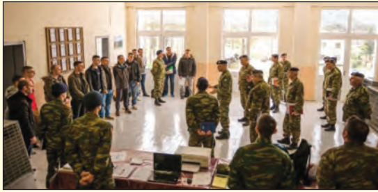
Επίσκεψη στο ΣΥΠΟ της 8ης Μ/Π ΤΑΞ

σε Σχηματισμούς, Σχολές και Υπηρεσίες του Στρατού Ήερās