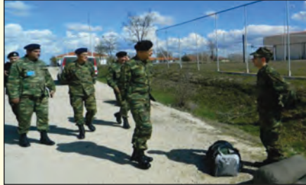
Επίσκεψη σε ΣΥΠΟ του Δ'ΣΣ