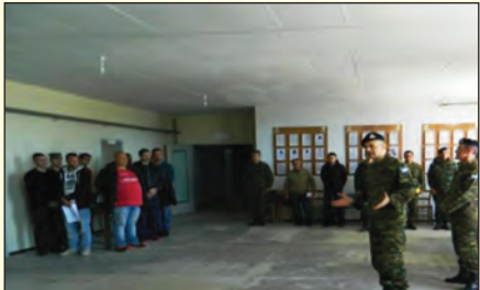
Επίσκεψη σε ΣΥΠΟ του Δ'ΣΣ