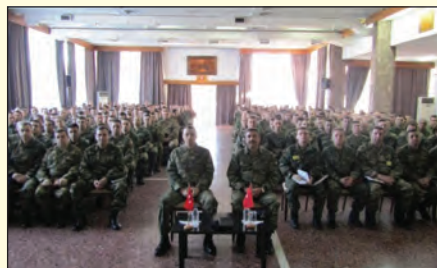
Επίσκεψη στη ΣΠΖ