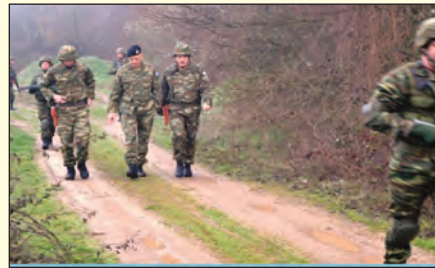
Επίσκεψη στην ΠΕ/ 3ης Μ/Κ ΤΑΞ