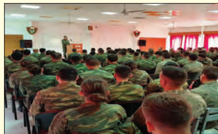
Επίσκεψη στο ΚΕΤΘ - ΣΤΘ