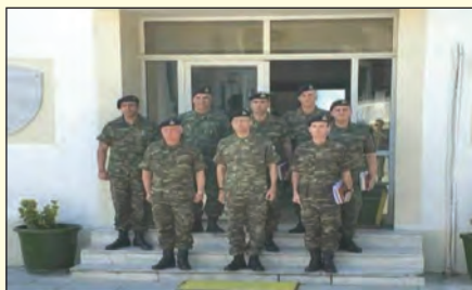
Στο 784 ΤΜΕ