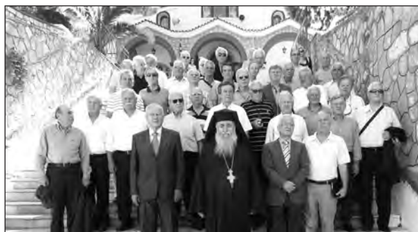
ΙΕΡΟΔΙΔΑΣΚΑΛΕΙΟΝ. Για τέτοιο είχε φτιαχτεί το κτίριο κάποτε μα στη πορεία έγινε Σχολή Χωροφυλακής...

Μπορεί να μη γίναμε ιεροδιδάκαλοι, ιερομόναχοι ή ιεροκήρυκες...Ξέρω όμως ότι η τάξη μου έβγαλε ικανούς αξιωματικούς για το ρόλο που τους προόριζε η Πολιτεία, η