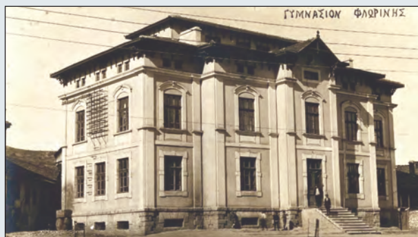
Το παλιό Γυμνάσιο Φλωρίνης, έδρα του 496 ΤΔΒ. Κατεδαφίστηκε το 1978

βρουαρίου 1949, την οποία ο στρατηγός Van Fleet θεωρούσε ως «την πρώτη επιτυχή επιχειρήση εναντίον των επιθέσεων των κομμουνιστών σε μεγάλα χωριά». Η πολιορκημένη απο αντάρτες πόλη τελικά κρατήθηκε ελεύθερη και η έκβαση της μάχης γέμισε ενθουσιασμό όλους τους Έλληνες, αφού κυριολεκτικά συνετρίβει ο εχθρός.