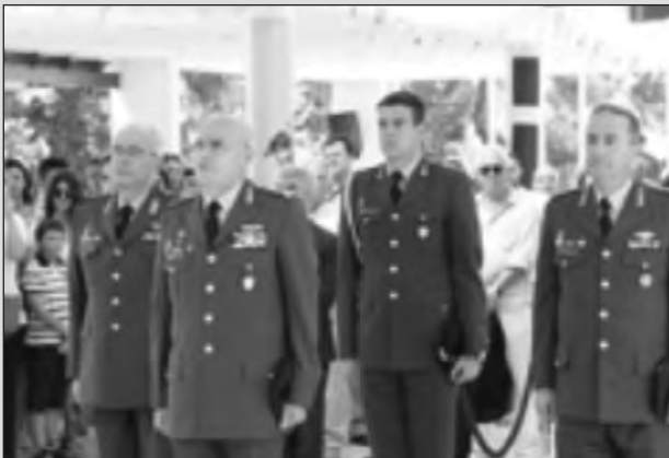
της Σχολής. Ακολούθως απονεμήθηκαν τα Πτυχία στους αποφοιτήσαντες νέους Ουλαμαγούς Πυροβολικού. Στους πρωτεύσαντες επιδόθηκε και το Έμβλημα της Σχολής. Μετά, οι Ανθυπολοχαγοί κατέθεσαν στέφανο στο Μνημείο του Πυροβολητού.