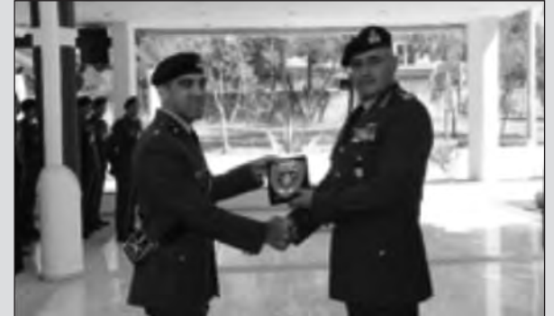
Τη γιορτή στο Αμφιθέατρο έκλεισε ο Διοικητής Στρατιάς Αντγος κ. Δημόκριτος Ζερβάκης, ο αρχαιότερος εν ενεργεία Αξιωματικός του Πυροβολικού, με έναν εμπνευσμένο πατριό και συνάμα διδακτικό λόγο προς τους/ες αποφοιτήσαντες/σες, πλήρη ευχών, παραιέσεων και νουθεσιών.

Η γιορτή συνεχίσθηκε στο αμφιθέατρο της Σχολής, όπου ο Δκτής της Σχολής, Ταξίαρχος Μανώλης Ματαντωνάκης, απεύθυνε χαιρετισμό. Ακολούθως αναγνώσθηκε σύντομο ιστορικό του Πυροβολικού και της Σχολής. Ο Λόγος δόθηκε μετά στον Πρόεδρο του Συνδέσμου Αποστράτων Αξιωματικών Πυροβολικού, Αντγο κ. Αθανάσιο Νικολοδήμο απεύθυνε χαιρετισμό και ευχές στους αποφοιτήσαντες. Απονεμήθηκαν αναμνηστικά στους παρευρεθέντες επισήμους και βραβεία και τιμητικές διακρίσεις σε Αξιωματικούς και Υπαξιωματικούς του Πυροβολικού για διακεκριμένες πράξεις τους. Σε όλους ανεξαιρέτως τους παρευρεθέντες απονεμήθηκε ως αναμνηστικό της ημέρας το σύμβολο του Πυροβολικού και η εικόνα της Αγίας Βαρβάρας.