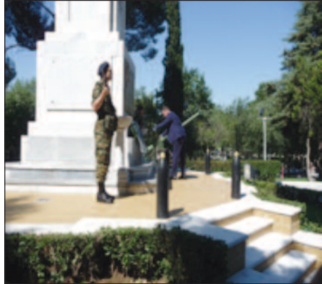
δόξα και τιμή των πεσόντων στην Κύπρο συμμαθητών της Τάξεως 1968 ΣΣΕ».