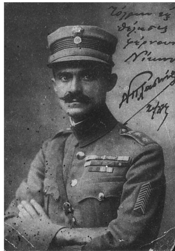
Νικόλαος Πλαστήρας

Κατά την κατάρρευση του μετώπου και την άτακτη υποχώρηση, κατέληξε, προς κοινή ομολογία, φίλων και αντιπάλων, να έχει υπό τη διοίκησή του το μοναδικό συγκροτημένο και αξιόμαχο τμήμα. Εγκατέλειψε σχεδόν τελευταίος και με πόνο ψυχής τα προ αίωνων πάτρια εδάφη της Μικράς Ασίας.