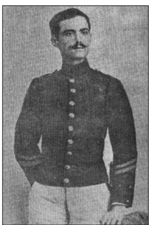
Ο Ν. Πλαστήρας Υπαξιωματικός.

Στις εκλογές και το δημοψήφισμα του Νοεμβρίου 1920, επανήλθε ο Βασίλειος Κωνσταντίνος και όλοι οι βενιζελικοί Αξιωματικοί αποχώρησαν από τη Στρατιά της Μ. Ασίας, γιατί επανήλθαν όλοι οι απομακρυνθέντες από το 1916 Αξιωματικοί.