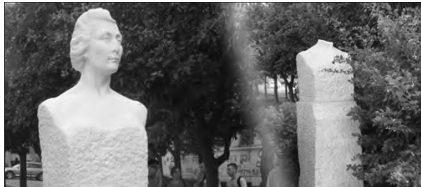
Η προτομή της Λένας Καραγιάννη πριν και μετά τον απογεφαλισμό από βάνδαλους.

Οι στρατιώτες φύλακες είναι «δευτέρως κατηγορίες