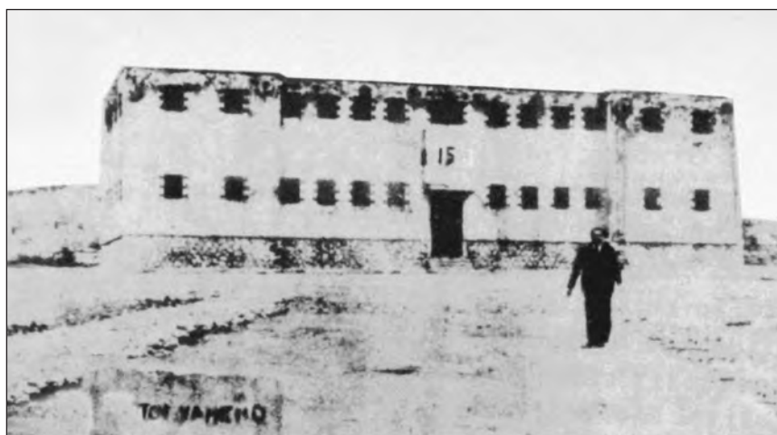
Το ΜΠΛΟΚ 15 στην Δεκαετία 1950

Όμως, τι ειρωνεία. Το ίδιο βράδυ για 59 από αυτούς σβήνει κάθε ελπίδα να αναπνεύσουν τον αέρα της ελευθερίας. Και οι 59, μετά από ονομαστική επιλογή του αρχηγείου των SS, οδηγούνται αμέσως στα κρατητήρια της οδού Μέρβιν. Όλοι είναι αγνοί πατριώτες, μέλη μυστικών αντιστασιακών οργανώσεων κυρίως της οργάνωσης «Υβόνη», της επονομαζόμενης «αόρατης στρατιάς», δραστηριοποιούμενη σε όλο τον ελληνικό χώρο, με αποστολές κατασκοπίας και δολιοφθορών. Όλοι έχουν συλληφθεί πριν από μερικούς μήνες μετά από προδοσία και έχουν βάνουσα βασανιστεί.