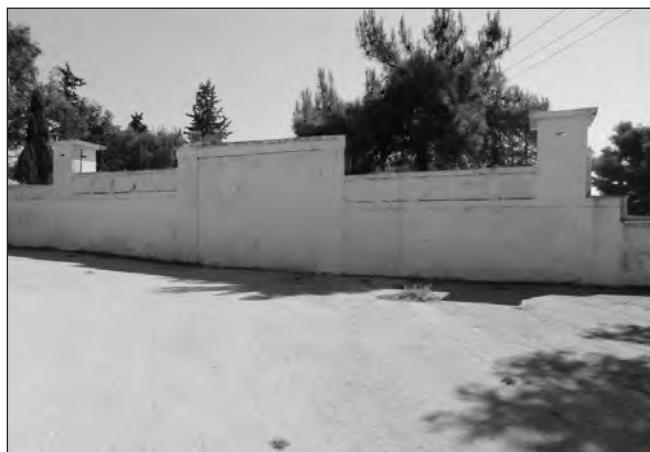
Αριστερά η παλαιά πύλη του Στρατοπέδου κτισμένη όπως είναι σήμερα και δεξιά το 1947

Η άνευ όρων όμως παράδοση της Ιταλικής κυβερνήσεως