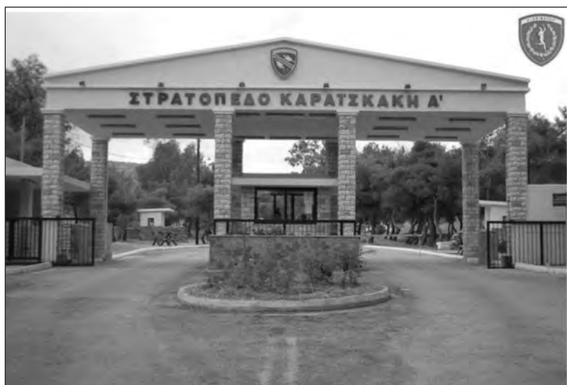
Η σημερινή πύλη του Στρατοπέδου σε νέα θέση.

Το μεσημέρι της 7ης Δεκεμβρίου 1943 φθάνει στο στρατόπεδο μια δωδεκαμελής ομάδα κρατουμένων από τις φυλακές Αβέρωφ. Μεταξύ αυτών είναι σιδηροδέσμιος, ρακέन्दυτος και ξυλοδαρμένος, ο Ισραηλίτης έφεδρος υπολοχαγός του ελληνικού στρατού Λευή, καταγόμενος από τα Ιωάννινα. Στο απογευματινό προσκλητήριο, της ίδιας ημέρας, παρουσία όλων των κρατουμένων ο διοικητής του στρατοπέδου ταγματάρχης των SS Paul Radomski, που μόλις προ οκταμήνου έχει αναλάβει τη διοίκηση, θέλοντας να τρομοκρατήσει τους κρατούμενους αλλιά και να επιδείξει ότι τηρεί πιστά τις αρχές των SS, διατάσσει το δύστυχο υπολοχαγό