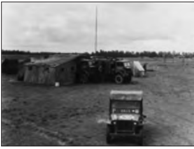
Απόσπασμα PHANTOM. Οχήματα ΔΒ και Κ/Τ.

μέρωση του Τσάρτσιθ, αναλυτικών πληροφοριών της εξέλιξης των επιχειρήσεων από κάθε περιοχή που είχαν αναπτυχθεί. Αλλίες αποστολές τους ήταν η παρακολούθηση εχθρικών δικτύων, η καθοδήγηση αεροπορικών προσβολών και η εκτίμηση της αποτελεσματικότητας τους, η αναφορά κινήσεων εχθρικών Μονάδων, η εκτίμηση ηθικού φίλιων τμημάτων κλπ. Για το σκοπό αυτό διέθεταν ειδικούς ασυρμάτους μεγάλης ισχύος, επι αξιόπιστων οχημάτων, με εκχωρημένες αποκλειστικές συχνότητες και ιδιαίτερες κρυπτογραφικές διαδικασίες.