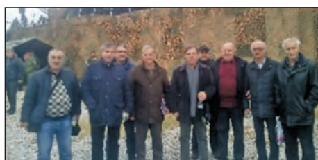
Μητροπολιτικό Ναό Ν. Κιλκίς. Στεφάνι κατέθεσε ο Πρόεδρος του Παραρτήματος, ο οποίος ήταν και ομιλητής για τον εορτασμό των Ε.Δ.

-Την 21η Νοεμβρίου 2018 ο Πρόεδρος και μέλη του Παραρτήματος, παρέστησαν στον εορτασμό Εισοδίων Της Παναγίας - εορτασμού των Ενόπλων Δυνάμεων και τιμής αποστράτων/βετεράνων, η οποία τελέστηκε στο Ιερό