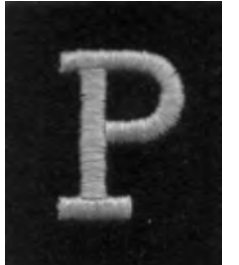
Το χαρακτηριστικό έμβλημα των PHANTOM

να τους επιτραπεί μια περιοδεία σε Κόρινθο-Θήμια-Τρίπολη, με συνοδεία Έλληνα αξιωματικού, για δοκιμή των μέσων επικοινωνιών.