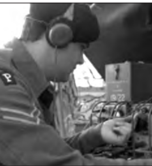
Χειριστής ασυρμάτου αποσπάσματος PHANTOM

Νωρίς στη διάρκεια του Β' ΠΠ οι Βρετανοί διέγνωσαν το πρόβλημα. Ο «κεραυνοβόλος πόλεμος» των Γερμανών και οι αναφορές από ταχύτατα εξελισσόμενες καταστάσεις δεν έφθαναν έγκαιρα στον αρχιστράτηγο. Ετσι συγκρότησαν μια ειδική απόρρητη Μονάδα το « Σύνταγμα Συνδέσμων Γενικού Στρατηγείου » (General HQ Liaison Regiment) το οποίο είχε το κωδικό όνομα « PHANTOM » (Φάντασμα) με έμβλημα της το γράμμα «Ρ» που έφεραν σε επίρραμα στο δεξιά βραχίονα. Δκτης του Συντάγματος ανέλαβε ο Ανχης G. F. Hopkinson, αρχικά με 48 Αξωματικούς και 407 Υπαξωματικούς, όλους εθελοντές, προερχόμενους κυρίως από τις Διαβιβάσεις αλλιά και από αλλιά Οπία. Μεταξύ αυτών και ο γνωστός ηθοποιός Ντέιβιντ Νίβεν . Το GHQLR συγκρότησε πολλή αποσπάσματα, που ενεργούσαν ανεξάρτητα και ταυτόχρονα, σε διάφορα μέτωπα της Ευρώπης και της βόρειας Αφρικής. Κύρια αποστολή τους ήταν η αναφορά απ ευθείας στην έδρα του Συντάγματος στο Λονδίνο προς εν-