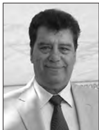
Γράφει ο ΙΩΑΝΝΗΣ ΛΕΒΟΥΡΟΣ Υποστράτηγος (ΕΜ) ε.α. Διευθύνων Σύμβουλος ΕΑΑΣ

Χάρη δεν χρωστάμε σε κανένα!! Το κλίμα ευφορίας που επιχειρεί να περάσει η κυβέρνηση, εκμεταλι-