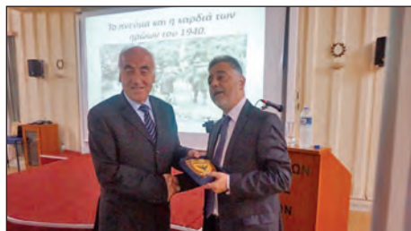
μέλη της ένωσης καθώς και μαθητές της Σχολής Μονίμων Υπαξιωματικών."

Με εξαιρετική επιτυχία πραγματοποιήθηκε η εκδήλωση του Τ.Σ. της ΕΑΑΣ Τρικάλων την 27ην Οκτωβρίου 2018 στη Λέσχη Αξιωματικών Φρουράς Τρικάλων, επί τη ευκαιρία της επετείου της 28ης Οκτωβρίου 1940, με ομιλητή τον κύριο Δημήτριο Πουλιανίτη Δικηγόρο και θέμα «Το πνεύμα και η καρδιά των ηρώων του 1940». Στην εκδήλωση παρευρέθησαν οι αρχές του τόπου, πλήθος κόσμου