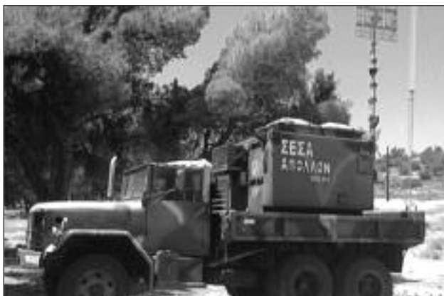
Κλωβός του Συστήματος ΑΠΟΛΛΩΝ στο Μουσείο της Σχολής ΔΒ

Η ιστορία του Οπλιού των Διαβιβάσεων είναι ένας διαρκής αγώνας των στελεχών του, ώστε, αφ ενός μεν να ικανοποιήσουν τις επιχειρησιακές απαιτήσεις και αφ ετέρου δε να παρακολουθούν στενά τις τεχνολογικές εξελίξεις, ώστε να ενημερώνονται, να εκπαιδεύονται και να παρέχουν τις πλέον σύγχρονες τεχνικές λύσεις. Το ΣΕΣ «ΑΠΟΛΛΩΝ», το πρώτο κινητό κρυπτασφαλισμένο επικοινωνιακό σύστημα στην Ελλάδα, σε όλο το διάστημα του «κύκλου ζωής» του αναμφίβολα επέβησε αποτελεσματικά το πρόβλημα των επικοινωνιών στις ευαίσθητες περιοχές της χώρας μας.