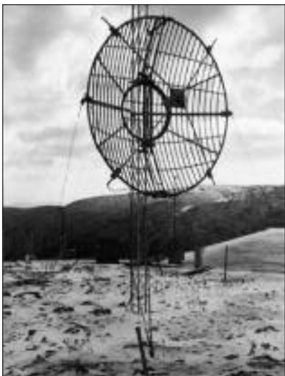
Παραβολική κεραία Πολυδιαυλικών σε κορυφή χιονισμένου βουνού