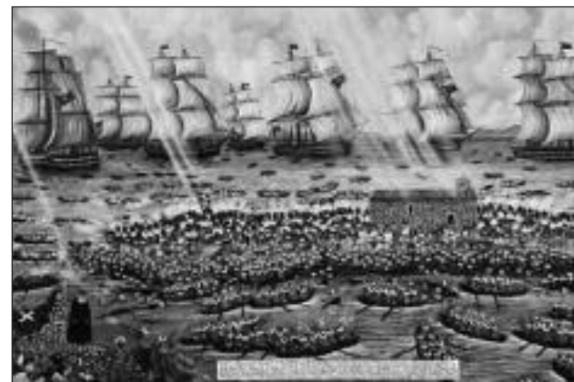
και άλλων υπερασπιστών της γης του Μεσολογγίου.

Γίνονται τέσσερις αλληπαλήθηδες επιθέσεις! Τέσσερις! Και αποκρούονται όλες! Στις 12 το μεσημέρι, κάπου 7 ώρες μάχης μετά, τρομοκρατημένοι οι Τουρκοαιγύπτιοι από τις εκατοντάδες απώλειες, αποφασίζουν να απομακρυνθούν από την Κλείσοβα. Μετρούν πολλούς νεκρούς και τραυματίες. Ο Ιμπραήμ επιμένει. Δίνει διαταγή να επιτεθούν 2.500 άντρες του από τον τακτικό στρατό του και μπαίνει επικεφαλής τους. Η υποδοχή που του επιφυλάσσει ο Τζαβέλλας και οι άντρες του είναι το ίδιο