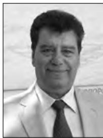
Γράφει ο ΙΩΑΝΝΗΣ ΔΕΒΟΥΡΟΣ Υποστράτηγος ε.α. Διευθύνων Σύμβουλος ΕΑΑΣ

Μόλις ενενήντα ημέρες από τις Εθνικές Εκλογές της 7ης Ιουλίου, η χώρα φαίνεται να έχει βιώσει καθολικά, συμπυκνωμένο πολιτικό χρόνο.