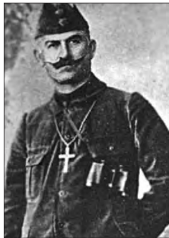
Ο Ταγματάρχης Χωροφυλακής Σπύρος Σπυρομήλιος

Με την απόλυτον πεποίθησιν ότι και τώρα όπως πάντοτε θα ταχθήτε υπό την ιεράν σημαία της Πατρίδος συναγωνιζόμενοι μετ’ εμού του φυσικού σας Αρχηγού και των υπ’ εμέ γενναίων θέλητε μετά γενναιότητος και αυταπαρνήσεως υπερασπισθή της ελευθερίαν σας εναντίον παντός εχθρού, αναδεικνυόμενοι άξιοι απόγονοι των εν Αραχώβη, Μεσσηλογγία, Πέτα και λοιπά μέρη πεσόντων προγόνων σας.