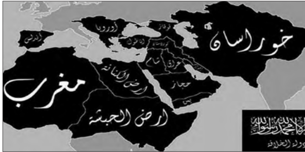
Το δημοσιοποιημένο όραμα - στόχος των φανατικών Ισλαμιστών, η Ισλαμική Αυτοκρατορία

Εύλογες και δυνατές ενέργειες της ΕΕ είναι οι άμεσες