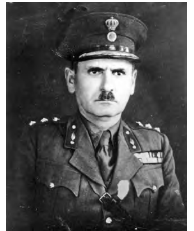
Αντισυνταγματάρχης Πεζικού Δημήτριος Π. Θεοδωράκης

Ο Στρατηγός Δημήτριος Θεοδωράκης, με καταγωγή από την Αμπλιανη Ευρυτανίας, μεγάλωσε κατά τα παιδικά και μαθητικά του χρόνια στο Μεσολόγγι. Κατατάχθηκε εθελοντής στο Στρατό το 1910 και αποστρατεύθηκε το 1945. Η μακρόχρονη πολεμική δράση και η προσφορά του στην Πατρίδα είναι αξιοθαύμαστη. Έλαβε μέρος σε όλους τους Απελευθερωτικούς