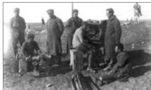
Σταθμός ασυρμάτου εν λειτουργία.