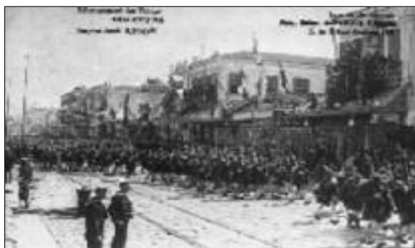
Το 1/38 Σύνταγμα Ευζώνων παρελαύνει στη 15/5/1919

Αυτός ο τόπος ο σεμνός που ξένοι τον πατούνε ας γίνει τάφος ιερός