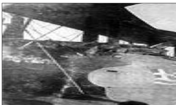
Ελληνικό Πολεμικό Αεροπλάνο της ΝΑΜΣ. Το βομβαρδιστικό «Σπέτσαι», Airco De Havilland D.H.9