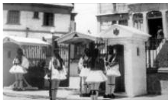
Φρουρά Ευζώνων στο Διοικητήριο Σμύρνης