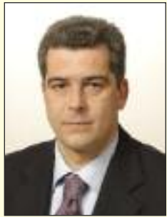
Γράφει ο ΧΡΗΣΤΟΣ Γ. ΧΡΗΣΤΙΔΗΣ Αντιπρυτανάρχης ε.α. Διευθύνων Σύμβουλος ΕΑΑΣ

Δύο έννοιες που στο Δυτικό κόσμο θεωρούνται σχεδόν ταυτόσημες ανάλογα με το κράτος και τη νομοθεσία που τις ενσωματώνει.