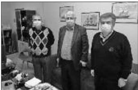
και αφορούν το γεωστρατηγικό μας περιβάλλον.

Κατά την συνάντηση αντηλλάγησαν απόψεις επί θεμάτων που αφορούν την τοπική μας κοινωνία, οικονομικών θεμάτων των απόστρατων αξιωματικών καθώς και των τεκταινομένων στη διεθνή πολιτική σκηνή