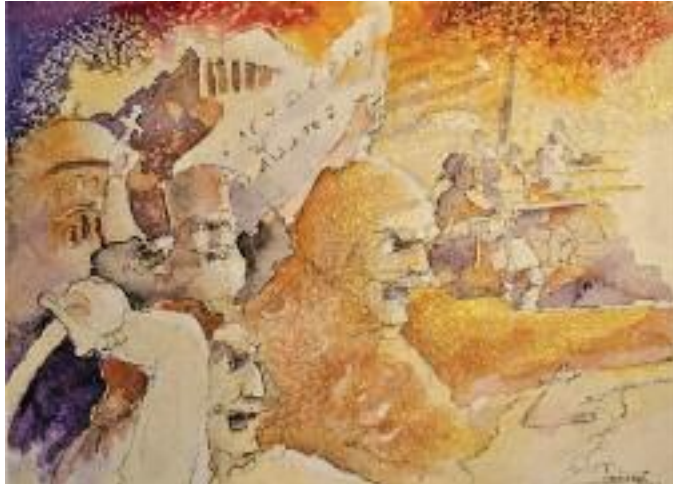
Το παρόν εικαστικό τιτλοφορείται «Ελευθερία ή Θάνατος». Φιλοτεχνήθηκε από τον Αντγο ε.α. Δημήτριο Κ. Μπάκα