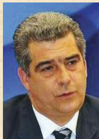
Γράφει ο Άννης (ΑΣ) ε.α. Χρήστος Χρηστίδης, Διευθύνων Σύμβουλος ΕΑ.Α.Σ.