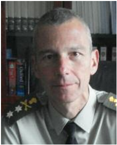
Γράφει ο Αντγος ε.α. Ιπποκράτης Δασκαλάκης -Διδάκτορας Διεθνών Σχέσεων στο Πάντειο Πανεπιστήμιο- Διευθυντής Μελετών του

Ελληνικού Ινστιτούτου Στρατηγικών Μελετών (ΕΛΙΣΜΕ)-Διαλέκτης στη Σχολή Εθνικής Αμύνης (ΣΕΘΑ)