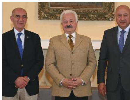
...και τη λήψη αναμνηστικών φωτογραφιών